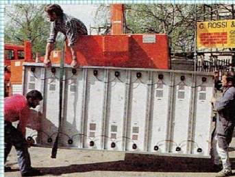
1 Baustein (9 Solarmodule Arco M-55)