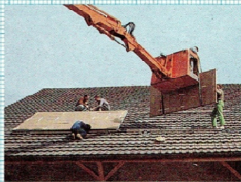
Montage auf Steildach